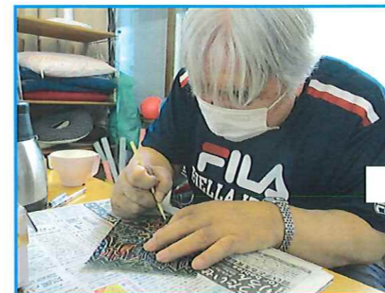
スクラッチアート