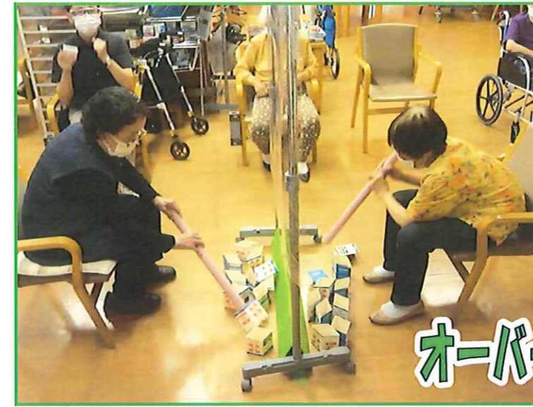
オーバー座マウンテン

中央にそびえ立つ「山」をリニューアルしました。制限時間は40秒で、普段おだやかな方も激しく手を動かされます。