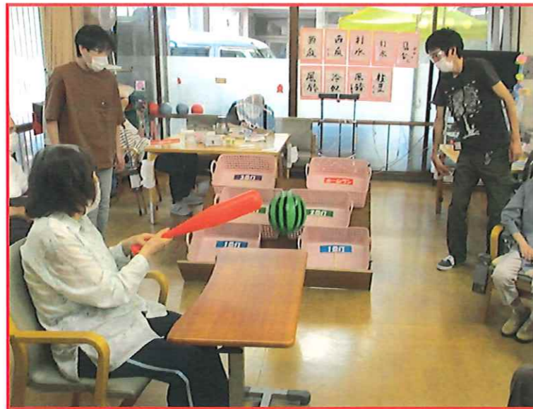
塔南ベースボール

いつもは向かい合わせでおこなっていますが、隣同士でやってみた時の様子です。これはこれでいい感じでした♪